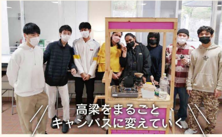
吉備国際大学 3チャレプロジェクトの皆さん (高梁市)

今年のテーマは『“場”をつくる人たち』。 どんな想いで、どんな手法で、新しい「場」を創造しているのか。それぞれが挑む「場づくり」に学ぶ！